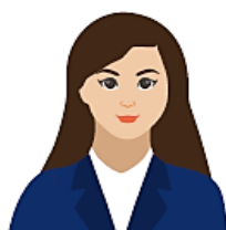
ÓRGANO O UNIDAD ORGÁNICA RESPONSABLE DE LA IMPLEMENTACIÓN DEL SCI

Es el responsable de la implementación del Sistema de Control Interno en la entidad.