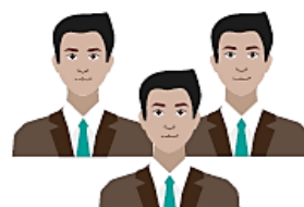
ÓRGANOS O UNIDADES ORGÁNICAS QUE PARTICIPAN EN LA IMPLEMENTACIÓN DEL SCI