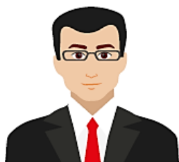
TITULAR DE LA ENTIDAD